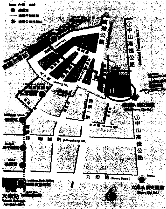
高雄榮民總醫院交通指引路線圖