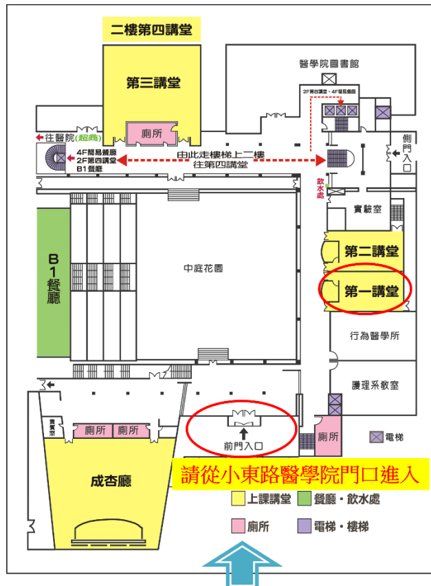
國立成功大學醫學中心講堂平面圖